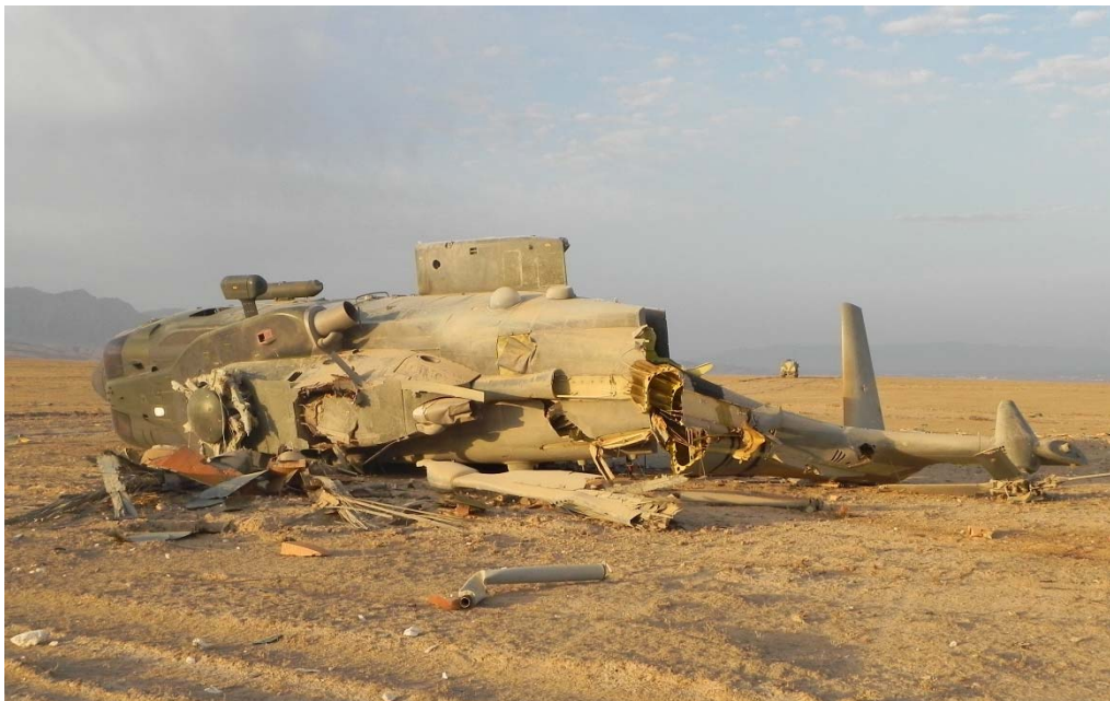
Helikopteren, inden oprydning var påbegyndt.

Piloten identificerede rystelserne som værende af en type betegnet "vertical bounce", hvorfor han slog stabiliseringssystemet fra og forsøgte at trække helikopteren i luften igen. Efterfølgende har Forsvarets Flyvehavarikommission vurderet, at rystelserne i stedet skyldtes "biomechanical feedback", hvilket kræver en anden reaktion fra piloten for at få helikopteren til at falde til ro. Det samlede forløb fra landing til havari tog ca. 20 sekunder. Herefter lå helikopteren på siden med knækkede rotorblade og haleparti. Alle ombord kunne forlade helikopteren ved egen hjælp via rampen bagude.