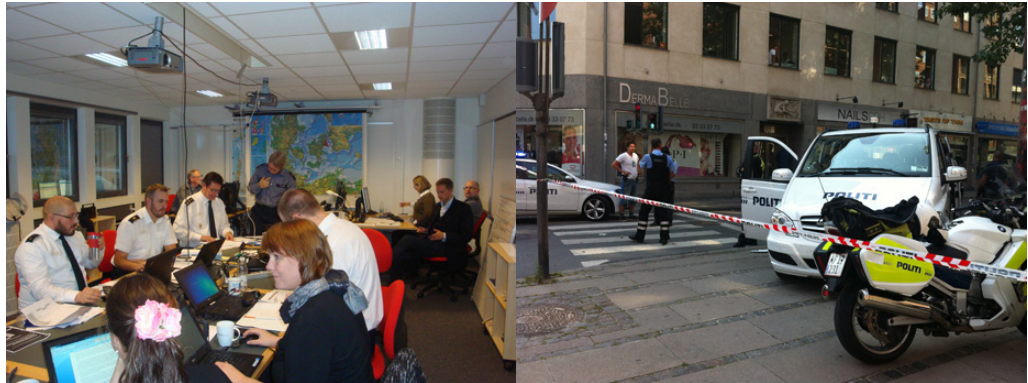
Krisestyringen ved den nationale krisestyringsøvelse i 2013 og politiets indsats ved en mindre hændelse i 2013.

Derudover er der etableret en national operativ stab (NOST), som koordinerer den samlede indsats ved hændelser, hvor der er behov for at koordinere på nationalt plan. Rigspolitiet har formandskabet for staben. Staben skal sikre, at de respektive sektorer løbende er i besiddelse af relevante, koordinerede og præcise oplysninger om den konkrete indsats ved en hændelse. De centrale myndigheder i beredskabet er medlemmer af staben, fx Beredskabsstyrelsen og Sundhedsstyrelsen. En række andre aktører vil afhængigt af den konkrete hændelse kunne deltage i staben.