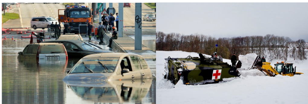
Skybrud i Storkøbenhavn og ekstremt snevejr på Bornholm.

Myndighederne har dermed ikke sikret, at erfaringerne fra 4 væsentlige større ulykker og katastrofer skriftligt er blevet fastholdt og systematisk fulgt op med henblik på at forbedre beredskabet. Evalueringsinstituttet i Beredskabsstyrelsen har dog udarbejdet en redegørelse om hændelsesforløbet ved skybruddet i Storkøbenhavn og en forundersøgelse til en evaluering af det ekstreme snevejr på Bornholm. Evalueringen blev dog aldrig gennemført. Politiet har ved skybruddet i Storkøbenhavn, det ekstreme snevejr på Bornholm og askeskyen mundtligt evalueret den tværgående koordinerende indsats. Politiet henviser til, at en skriftlig evalueringsrapport ikke i sig selv er afgørende for, om politiet uddrager og fremadrettet lærer af en hændelse. Rigsrevisionen finder dog, at en skriftlig evaluering er central for at fastholde læringspunkter og udbrede læring. Rigsrevisionen finder det derfor tilfredsstillende, at politiet er i gang med at udvikle et koncept for at evaluere sine indsatser.