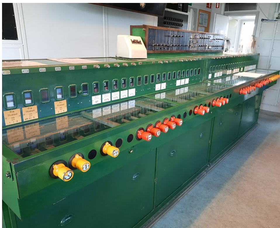
Ældre sikringsanlæg på Struer Station. Anlægget er taget ud af drift i februar 2021.

7. Banedanmark er som styrelse under Transportministeriet ansvarlig for at drive jernbanen. Banedanmark igangsatte i 2009 et projekt – Signalprogrammet – der har til formål at modernisere jernbanen. Formålet er ifølge Banedanmark at udskifte de nuværende analoge signaler, som ofte fører til fejl og forsinkelser, med digitale løsninger. Det gamle signalsystem er primært baseret på anlæg fra 1950'erne og 1960'erne. De ældste anlæg blev dog udviklet i 1912.