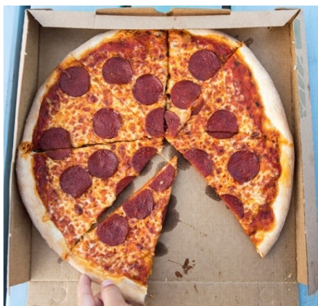
Fødevareemballage af pap og papir, som Fødevarestyrelsen fører kontrol med.